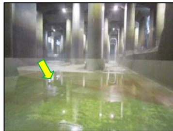
真ん中より手前がピカピカしていますね。ここまでが、見学可能ラインです。人力で綺麗にして下さっているそうです！

地上の入口から調圧水槽までは、100段強の階段です。この日は曇りで気温が高かったのですが、3分の1を下ったあたりで急に空気がひんやりしてきました。温度は20℃だったようですが、そこは水槽。かなり湿気が多いように感じられました。