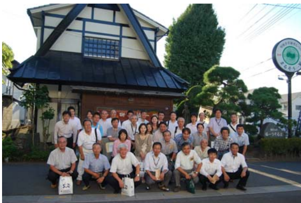
『まるそう一福本店』にて

約1時間バスに乗り、草加市内の「草加煎餅まるそう一福本店」を訪れ、店主のこだわり、歴史の説明を受けた後、出来たての醤油煎餅を試食し、工場・煎餅資料館・民具館等を見学しました。