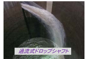
過流式ドロップシャフト

地下トンネルと河川の間には「立坑」が設けられており、全部で5箇所あります。地下トンネルで繋がるこの立坑は、第2～第5までが河川からの洪水を取り込む働きのほか、第1はトンネルから水を取り込み、調圧水槽との間で水量を調節する役目をしています。そのほか、管理車両の搬入や換気設備の取り付けなど、外郭放水路の維持管理面で重要な働きを果たしています。深さは約70m、内径も約30mもあり、スペースシャトルや自由の女神がすっぽり入る巨大な円筒状になって