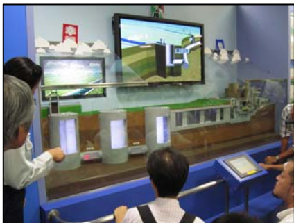
↑ 模型を使った説明の様子

地下トンネルと河川の間には「立坑」が設けられており、全部で5箇所あります。地下トンネルで繋がるこの立坑は、第2～第5までが河川からの洪水を取り込む働きのほか、第1はトンネルから水を取り込み、調圧水槽との間で水量を調節する役目をしています。そのほか、管理車両の搬入や換気設備の取り付けなど、外郭放水路の維持管理面で重要な働きを果たしています。深さは約70m、内径も約30mもあり、スペースシャトルや自由の女神がすっぽり入る巨大な円筒状になって