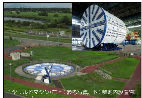
シールドマシン(右上:参考写真、下:敷地内設置物)

地底を走る「トンネル」について、工事は大深度(地下50m)、大口径(トンネル内10.6m)であることから、円筒状の鋼製の筒を地山に押しつけながら掘って作る、シールド工法を採用。マシンの背後には「セグメント」というパネルを一周に9つ用いて、円筒状に自動で組み立てながらトンネルを完成させます。ここで用いられたマシンは、1日あたり7～14mのシールドを構築したそうです。