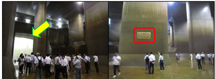
左奥に見えるのが、第1立坑です。柱の中央に貼ってあるのは、ポンプ停止水位ライン。水位が下がると運転が止まります。