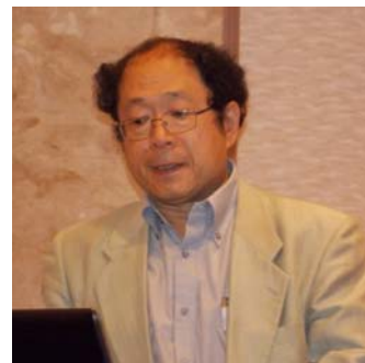
講演する丸茂先生

まだまだ課題の山積する放射性物質における土壌汚染ですが、さまざまな歴史を踏まえ貴重な意見を伺うことができました。