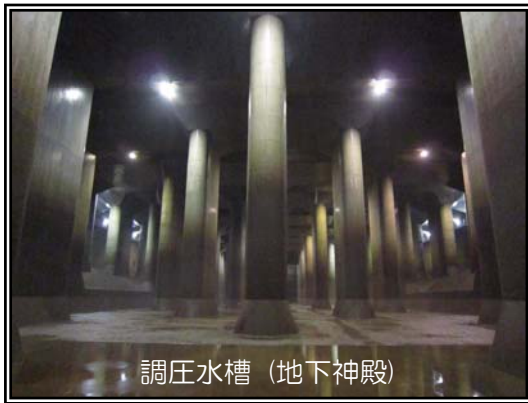
調圧水槽 (地下神殿)

「調圧水槽」は、地下約22mの位置に作られた、長さ177m、幅78m、高さ18m(サッカーコートおよそ1面分)に及ぶ巨大水槽です。ポンプ運転を安定して行うための役割と、緊急停止時に発生する急激な水圧の変化の調整を行う役割を持っています。